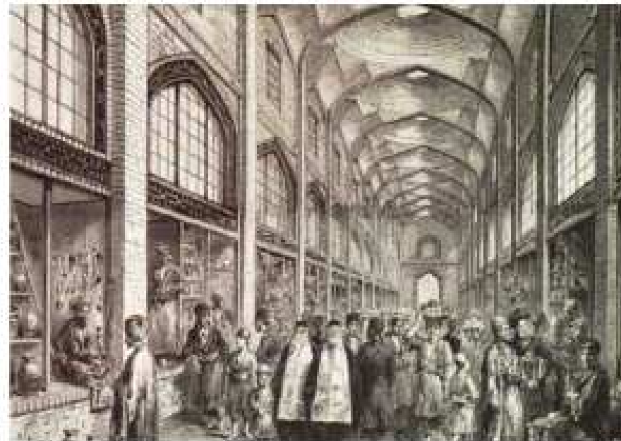
موسی نجفی، آندیشة تحریم و خودبیاوری، تحلیل متون و اسناد اقتصاد مقاومتی در تحولات سیاسی ایران، موسسه مطالعات تاریخ معاصر ایران، چاپ اول، تهران، ۱۳۹۱.

۱۳۱۶ ه‍.ق، توسط شیخ فضل الله نوری ۱ تلاش علما، سیاستون، طلاب، تجار و مردم برای تأسیس بانک ملی در کشور برای مبتلا شدن دولت به استقرار از دشمنان اسلام ۲ ، خرید سهام توسط علما/حاج آقا نورالله، شهید شیخ فضل الله نوری و ...، کمک برخی طلاب حتی با فروختن کتاب‌ها و تزیینات بعضی بانوان با فروش طلاهایشان ۳