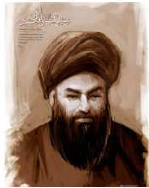
آیت‌الله سید عبدالحسین موسوی لاری